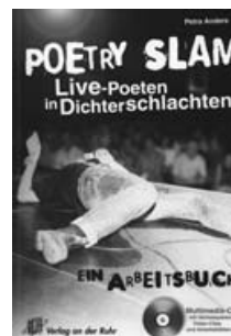
Ein Arbeitsbuch mit umfangreichen Materialien zum Thema „Poetry Slam“

Lege dir ein Notizbuch oder eine „Kladde“ zu, in die du deine