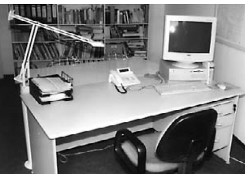
Ein Beispiel für „Vorher-Nachher“-Fotos im persönlichen Umfeld: der Schreibtisch des TIPP-Redakteurs.