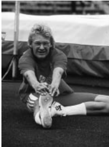
Christian macht Dehnungsübungen im Stadion, um erfolgreich zu sein. Die Schüler üben ihr Deutsch, um Erfolg in der Klasse zu haben.