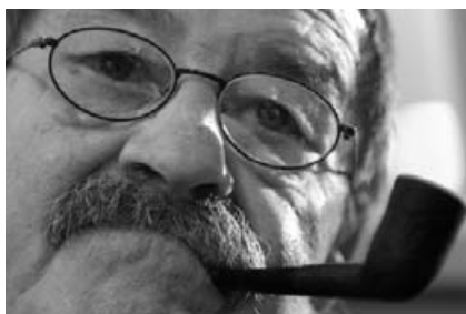
Warum hat Günter Grass seinen Roman „Hundejahre“ verschenkt?