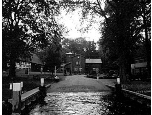
8. Die Fähre nähert sich der Anlegestelle.