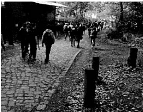
5. Die Schüler gehen zur Anlegestelle der Fähre.