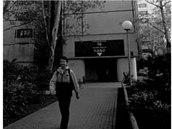
2. Er verlässt das Haus, in dem er wohnt.