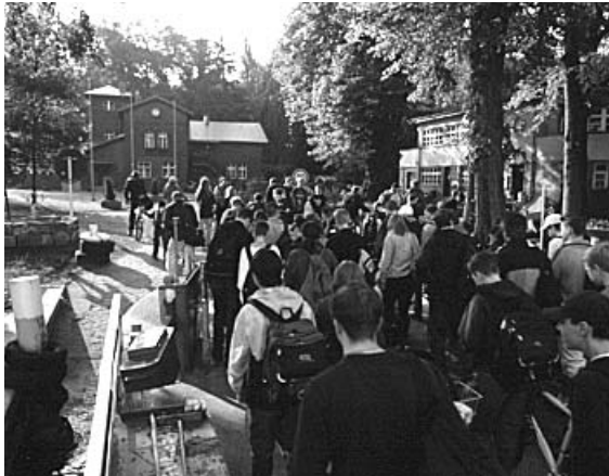
9. Die Schüler stürmen an Land.