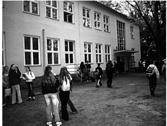
10. Die Schüler warten auf den Unterricht.