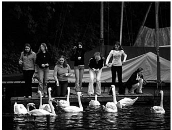
12. In der Pause füttern einige Schüler Schwäne.