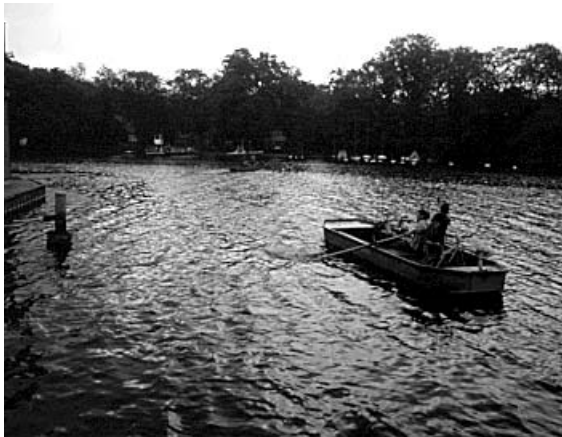
7. Wer die Fähre verpasst, muss rudern.

Schneidet die Fotos aus und klebt sie auf euren Spielplan in richtiger Reihenfolge zwischen zwei Spielfelder!